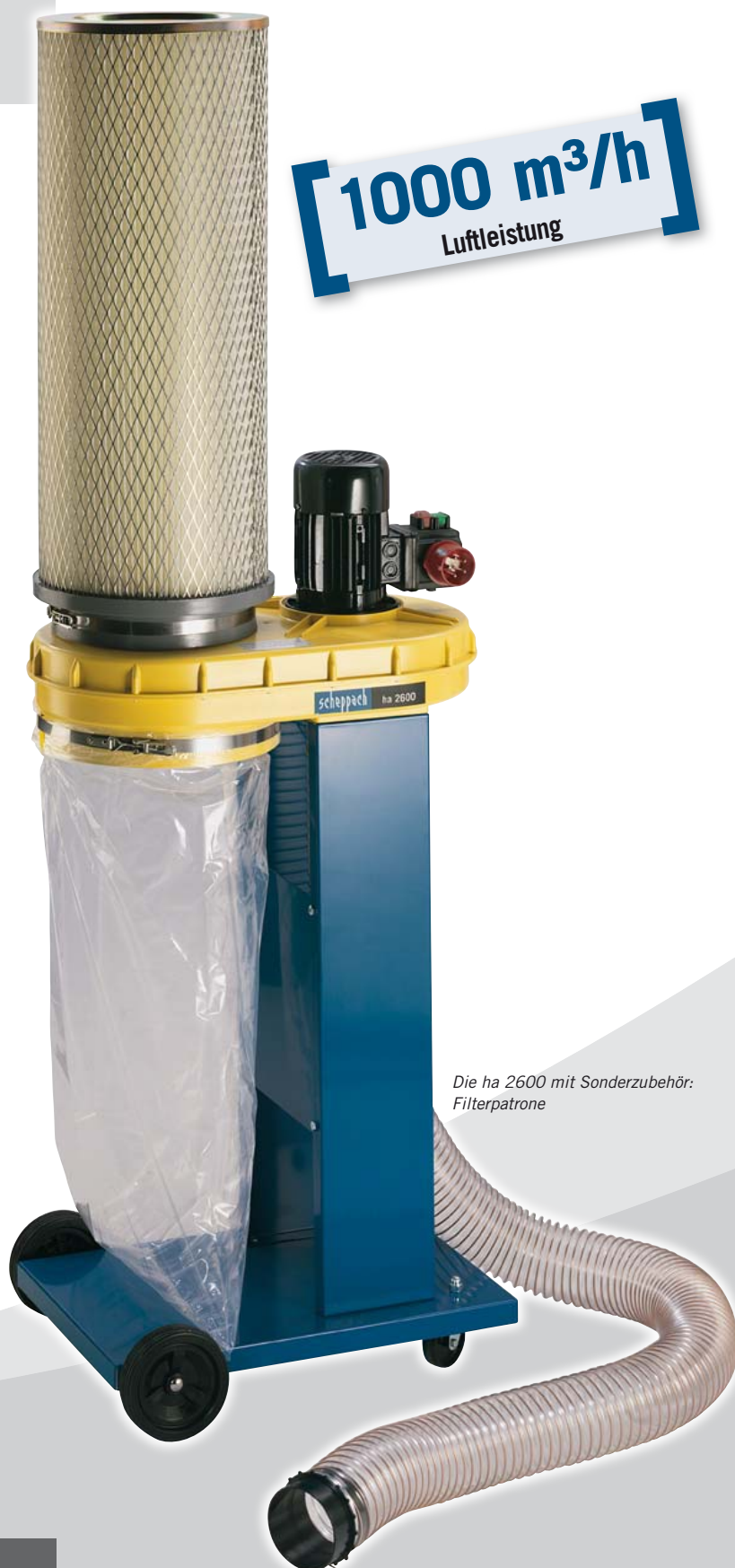
Die ha 2600 mit Sonderzubehör: Filterpatrone