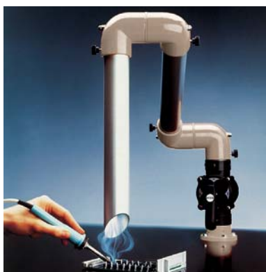
Lötrauchabsaugung mit dem Gelenksaugarm 50 D