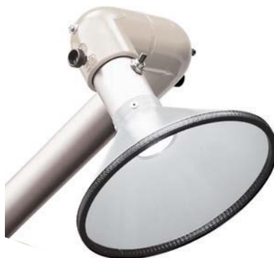
Auffanghaube mit Rundöffnung und Beleuchtung