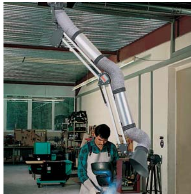
Kugelgelenk-Absaugarm im Einsatz

Der Kugelgelenk-Absaugarm ist vor allem dann hilfreich, sobald ein möglichst großer Arbeitsbereich benötigt wird. Die Montage kann sowohl an der Decke als auch an der Wand erfolgen.