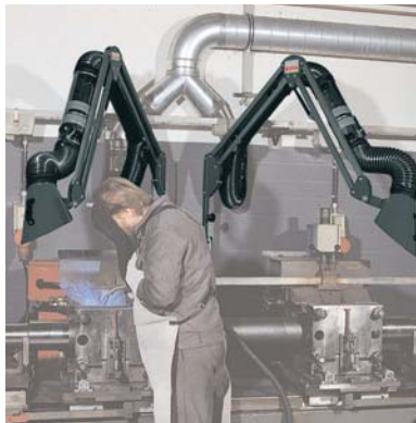
Absaugarme an einem Schweißplatz

Die ESTA Absaugarme sind leicht in jede Position zu bringen – Korrekturen sind schnell möglich. Dank der außenliegenden Trägerkonstruktion wird der Luftstrom nicht behindert.