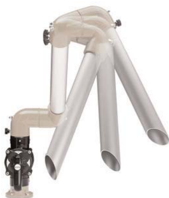
Gelenksaugarm 50 D

Die leichten Gelenksaugarme 50 D sind geeignet für feine Partikel oder Lötrauch und lassen sich schnell in jede Richtung verstellen. Ein stufenloses Drosselstromventil regelt den Luftstrom je nach Bedarf.