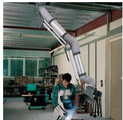
ESTA Kugelgelenk-Absaugarm an einem Schweißplatz