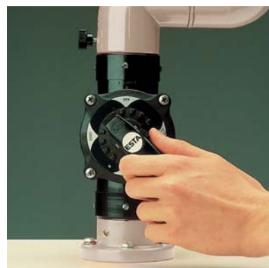
Luftstromdrosselventil zur Regulierung der Saugkraft