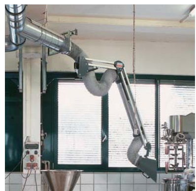
Absaugarm mit Ausleger in einem chemischen Betrieb