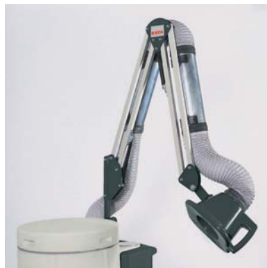
Absaugarm mit Haube für Schweißbrauch