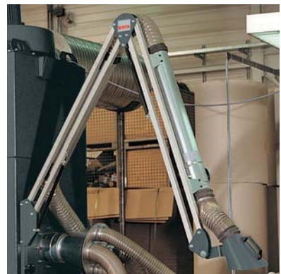
Absaugarm direkt am Gerät montiert