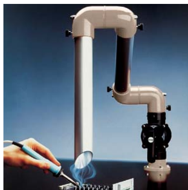
Gelenksaugarm 50 D bei der Löttrauchabsaugung