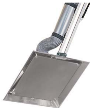
Absaugarm mit quadratischer Haube

Die ESTA Absaugarme sind leicht in jede Position zu bewegen – Korrekturen sind schnell möglich. Die quadratische Erfassungshaube ist ideal zur großflächigen Absaugung von Rauch und Feinstäuben.