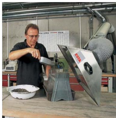
Quadratische Haube mit Prallblech