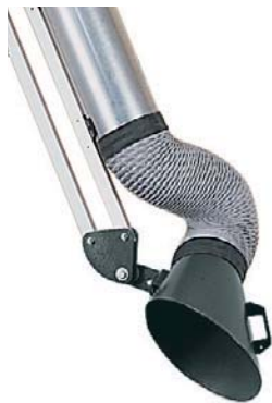
Absaugarm mit ovaler Haube