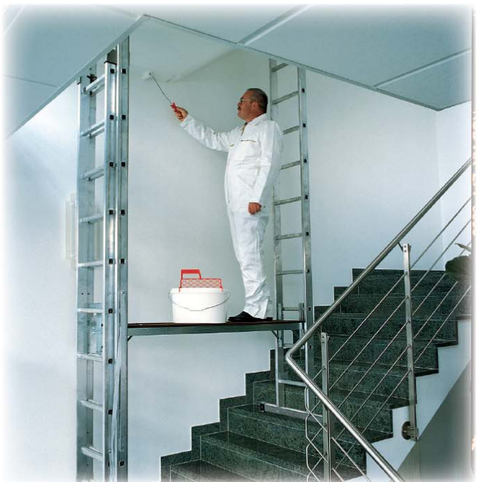
Abb. Best.-Nr. 30299 mit Leiter Best.-Nr. 33310