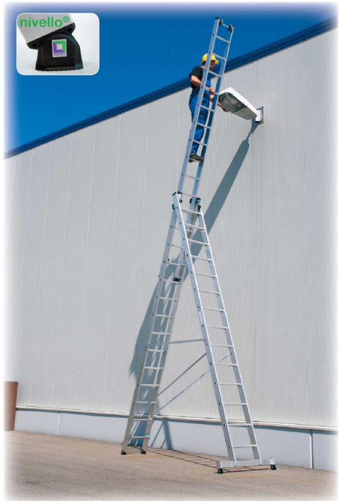
Abb. Best.-Nr. 33314