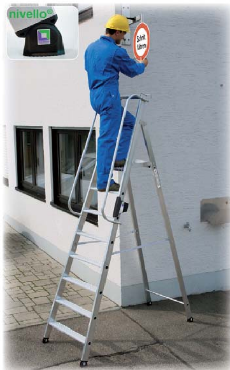
Abb. Best.-Nr. 50088