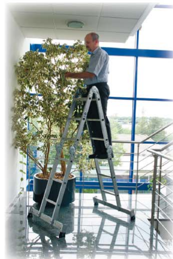
Abb. Best.-Nr. 31312