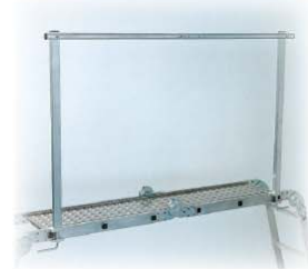
Abb. Best.-Nr. 30305 und Best.-Nr. 30303