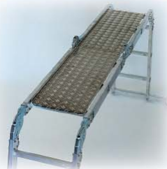
Abb. Best.-Nr. 30303