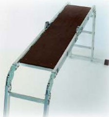
Abb. Best.-Nr. 30300

Alu-Geländer, anklammerbar für 31310, 31312 und 31314 Bestell-Nr. 30305 Euro