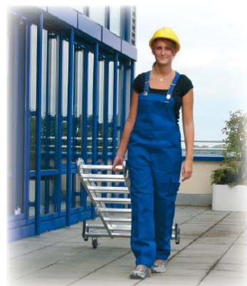
Abb. Best.-Nr. 31412