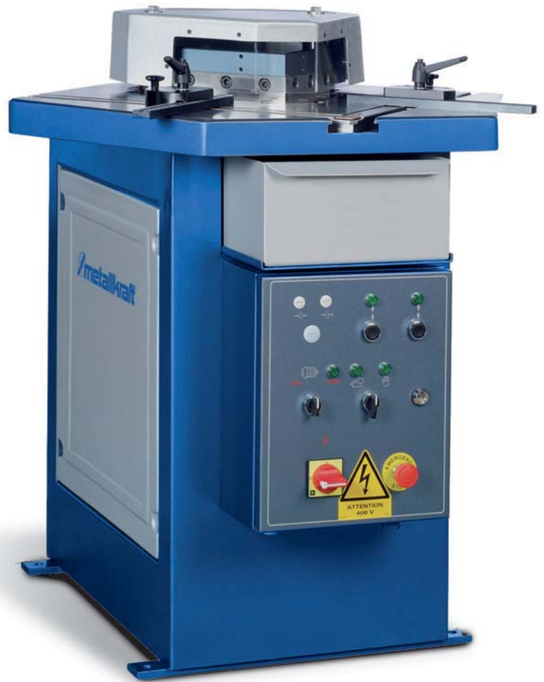
AKM - Serie mit fixem Winkel