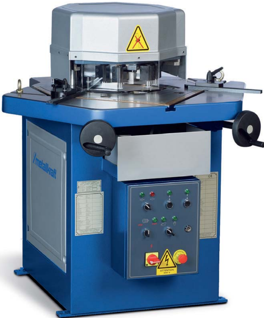
AKM V - Serie mit verstellbarem Winkel