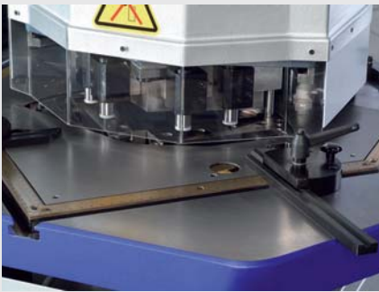
Arbeitstisch mit T-Nuten und vertieft angebrachten Maßskalen · Hydraulik-Niederhalter mit automatischer Schnittspaltverstellung (AKM 200-60 V)