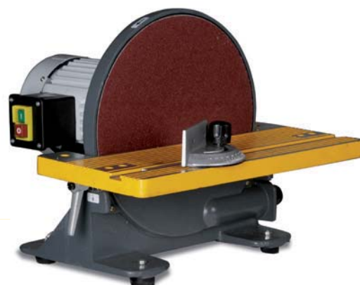
quantum TS 305