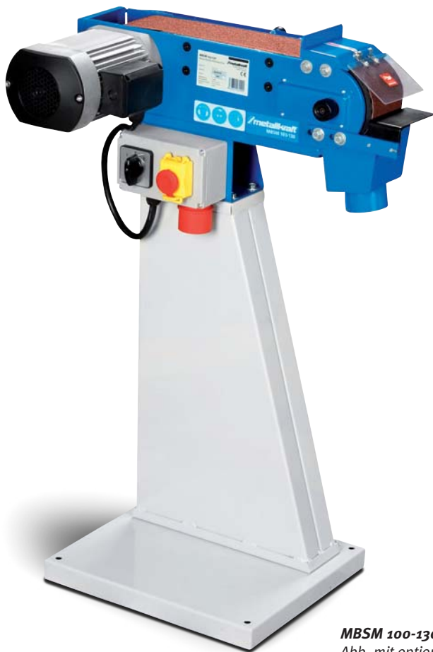
MBSM 100-130-2 Abb. mit optionalem Unterbau