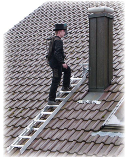
Abb. Best. Nr. 11113