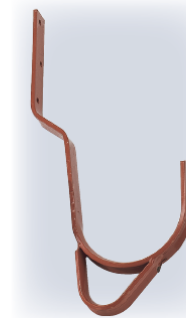
Abb. Best. Nr. 11119