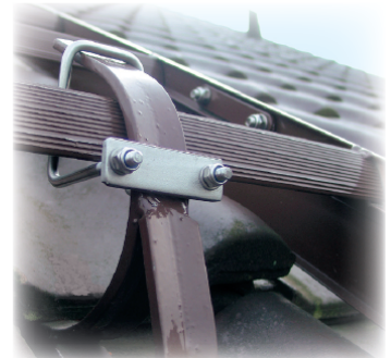
Abb. Best. Nr. 11204