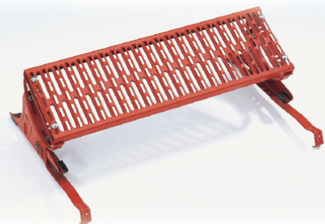
Abb. Best. Nr. 11176