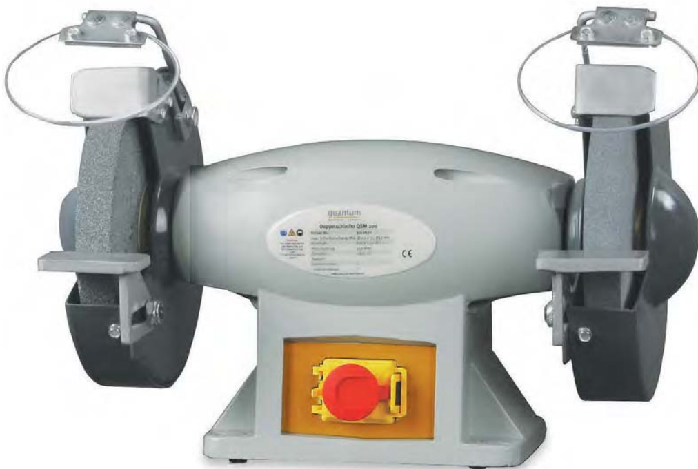
Abb.: QSM 175