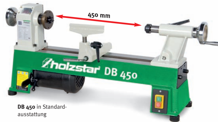
DB 450 in Standardausstattung