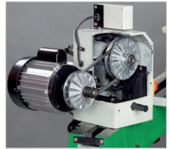
DB 1100 mit serienmäßigem Gussunterbau und optionaler Kopiereinrichtung (Art.Nr. 593 1102)

Variable Drehzahlregulierung von 500 - 2.000 1/min. über Keilriemen und verstellbare Konusscheiben.