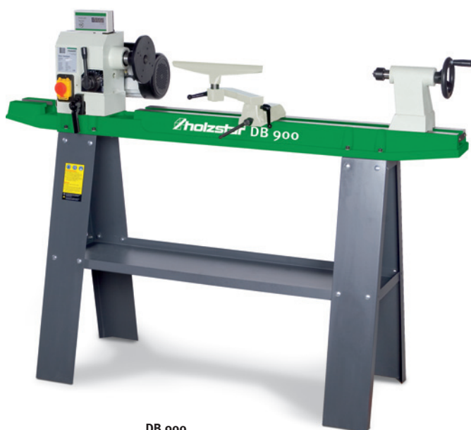
DB 900 Serienausstattung