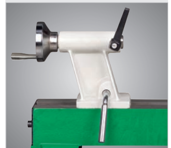
Der Reitstock aus Grauguss wird mittels Klemmhebel schnell und einfach fixiert. Die Verstellung der Pinole erfolgt über ein Handrad.