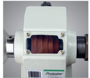
Mit Sichtfenster auf die Keilriemenscheibe zur Kontrolle der gewählten Drehzahl. Leichtes Umlegen des Keilriemens über Spannhebel.