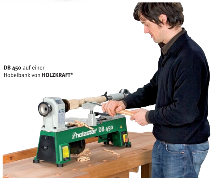
DB 450 auf einer Hobelbank von HOLZKRAFT®