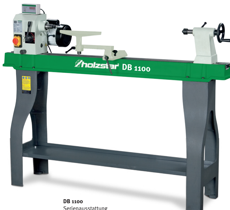
DB 1100 Serienausstattung