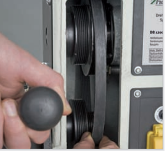
Werkzeugloses Wechseln der Übersetzungsstufe durch leichtes Ummontieren des Keilriemens