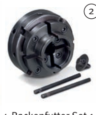
4-Backenfutter-Set 1 Ø 100 mm mit Schraubeinsatz