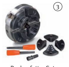
4-Backenfutter-Set 2 Ø 100 mm mit Wechselbacken und Schraubeinsatz