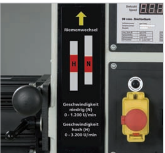
Variable Drehzahlregulierung von 0-1.200 (H) und 0-3.200 1/min. (L) in zwei Geschwindigkeitsstufen.