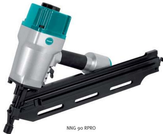
NNG 90 RPRO