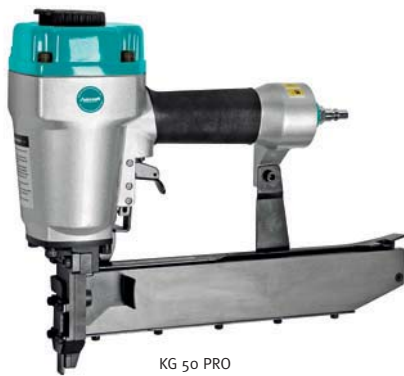
KG 50 PRO