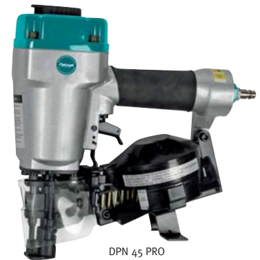
DPN 45 PRO