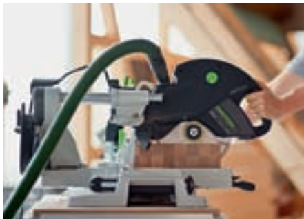
Die KAPEX ist kraftvoll und präzise: dank zweifach kugelgelagerter Doppelsäulenführung.

Winkel mit der Schmiege von Wand oder Ausschnitt abnehmen, auf die Anschläge übertragen und zusägen. Ebenso leicht arbeitet man mit den Kapp-Zugsägen KAPEX KS 120 und KS 88. Leicht, kompakt und vielseitig sorgen sie für exakte Ergebnisse in der Werkstatt oder auf Montage.