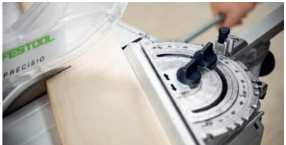
Die sind wandlungsfähig: Mit den Tischzugsägen PRECISIO CS 50 und CS 70 sind Längs- und Kappschnitte möglich. Mit nur einer Säge können so zwei Aufgaben erledigt werden. Ohne großes Umrüsten.