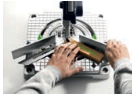
Mit Schmiege und patentiertem Anschlag: Mit der SYMMETRIC exakt und einfach Leisten sägen.

In der Werkstatt wie auf der Montage wechseln ständig die Aufgaben. Ob Kapp- oder Längsschnitte: Mit Festool sind Sie für alles bestens gerüstet.