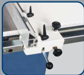
· Parallelanschlag serienmäßig mit Feineinstellung und Schnellspannung