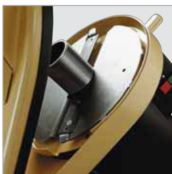
Zwei schräg liegende Wendemesser bringen doppelte Leistung beim Einziehen und Häckseln.