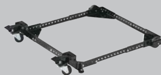
Universal-Fahrvorrichtung uni-drive 300 detaillierte Beschreibung siehe Seite 7 Bestell-Nr. 8800 1941