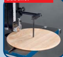
Kreisschneideeinrichtung HBS 431/433/533 Art.-Nr. 515 2001, € 49,00 zzgl. MwSt.