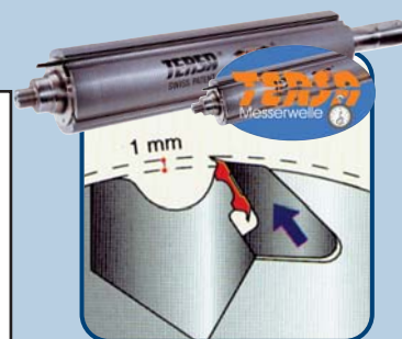
Abmessungen in mm