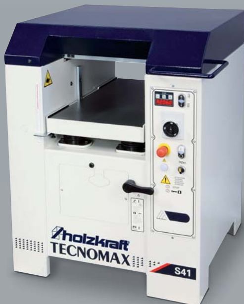
S 41 mit Option motorischer Dicktischverstellung