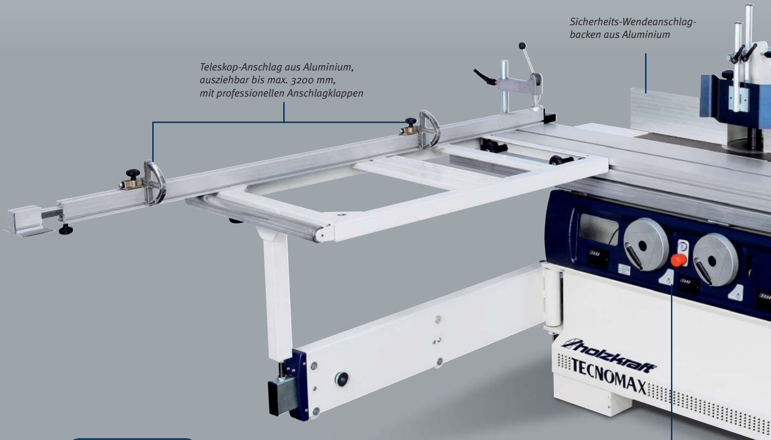
Teleskop-Anschlag aus Aluminium, ausziehbar bis max. 3200 mm, mit professionellen Anschlagklappen