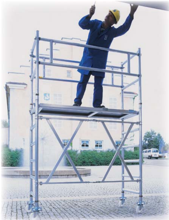
Abb. Best.-Nr. 115100