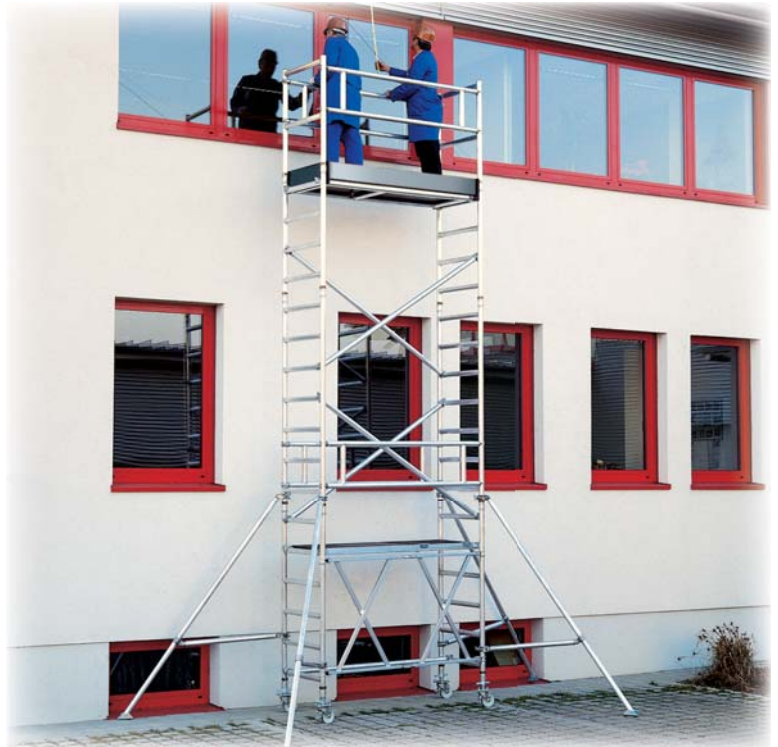
Abb. Best.-Nr. 115148