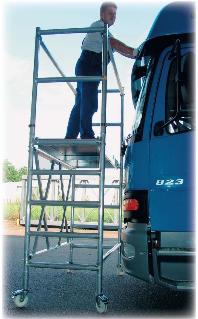
Abb. Best.-Nr. 115601