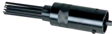
Nadelentroster-Vorsatz für MHU oder MHB

Ersatzmeißel passend zu Meißelhammer MHU / MHB / MHV