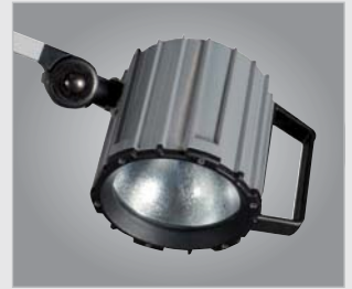
· serienmäßig mit Halogen-Arbeitsleuchte (IP65)