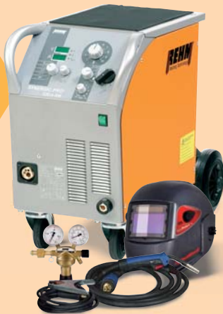
SYNERGIC-PRO 2 Kompakt-Baureihe