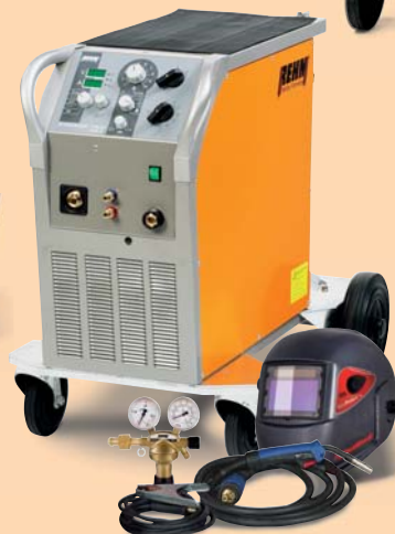
SYNERGIC-PRO 2 Industrie-Baureihe