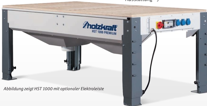
Abbildung zeigt HST 1000 mit optionaler Elektroleiste

HST 1000 PREMIUM statt € 2.150,00 zzgl. MwSt. 2.079,- € 2.474,01 inkl. MwSt. Art.-Nr.: 5170100