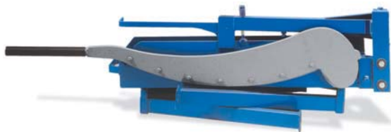
BSS 1000 mit zusammengeklappten Unterbau