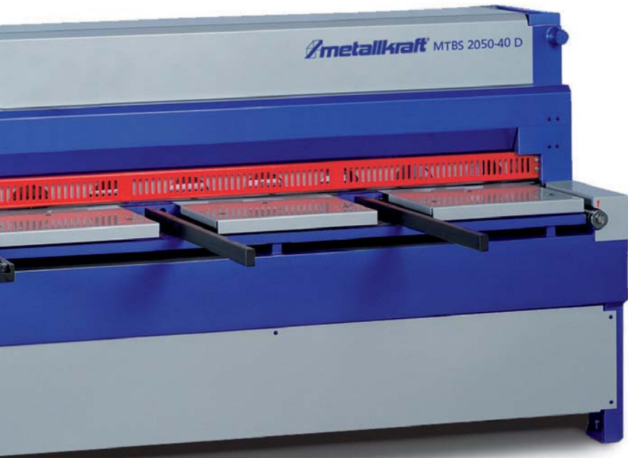
MTBS 2050-40 D Motorische Tafelblechscherer mit motorischem Hinteranschlag