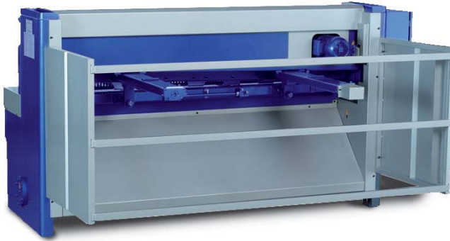
Rückansicht MTBS 2550-40 D