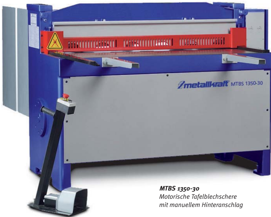
MTBS 1350-30 Motorische Tafelblechscher mit manuellem Hinteranschlag