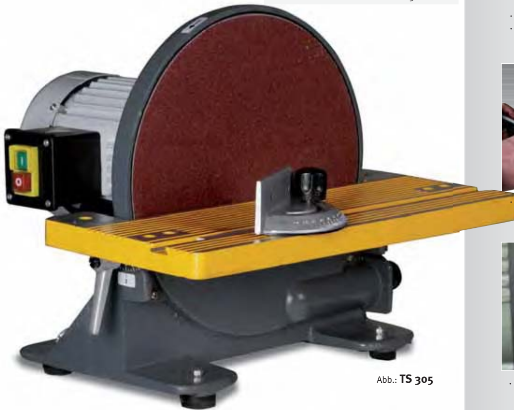
Abb.: TS 305