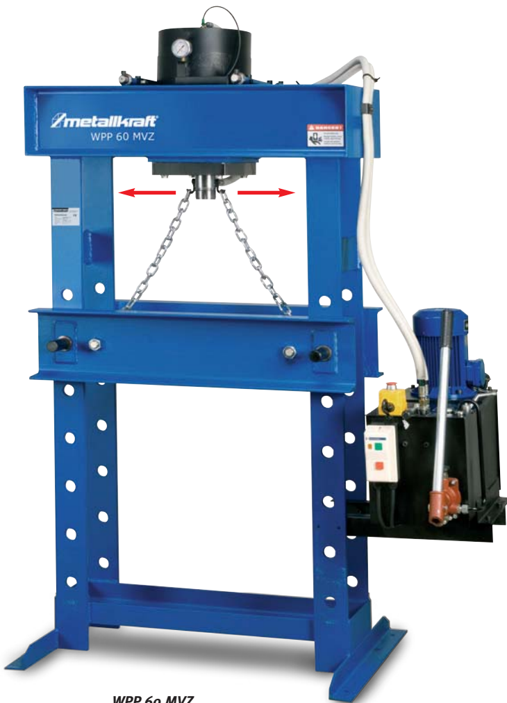
WPP 60 MVZ