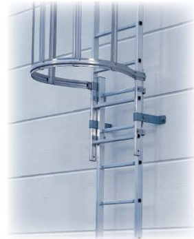
Abb. Best. Nr. 62446 in bestehender Leiter