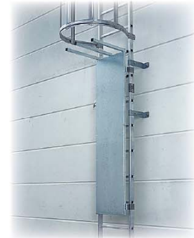
Abb. Best. Nr. 63498 in bestehender Leiter