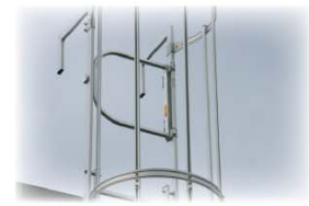
Automatisch schließende Sicherungstüre montiert an abgewinkelten Ausstiegsgeländern