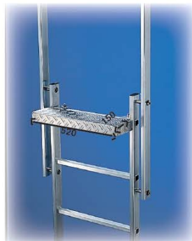
Abb. Best. Nr. 60945 in bestehender Leiter