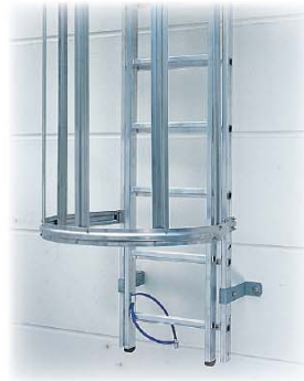
Abb. Best. Nr. 61445 in bestehender Leiter