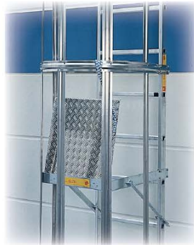
Abb. Best. Nr. 63255 - 64255 in bestehender Leiter

Gitterrostpodest für Leitern nach DIN 14094 auf Anfrage.